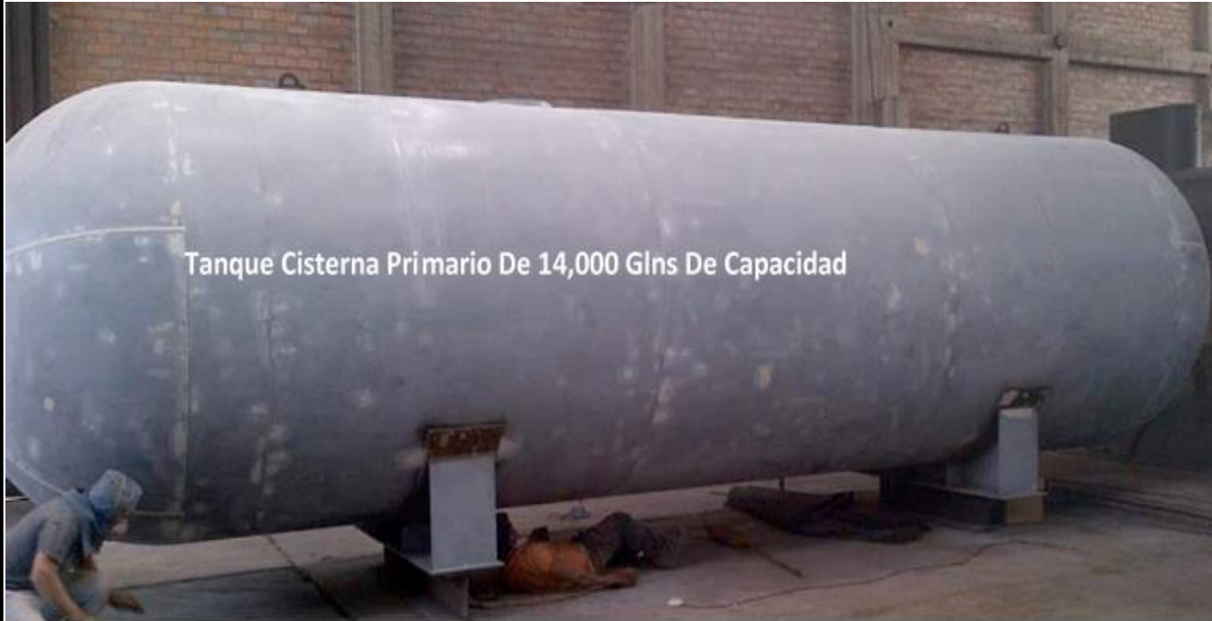
Tanque Cisterna Primario De 14,000 Glns De Capacidad