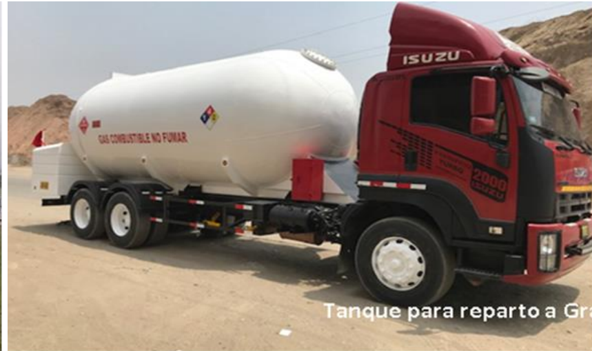
Tanque para reparto a Granel 6500 Glns