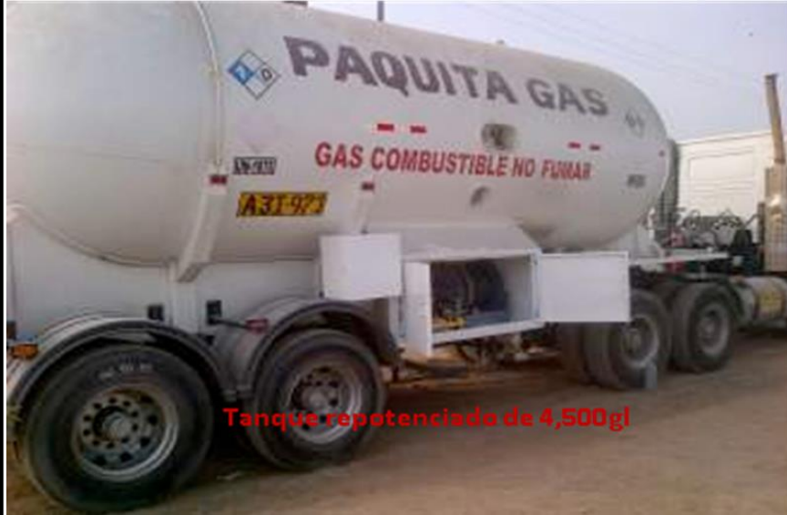
Tanque repotenciada de 4,500gl