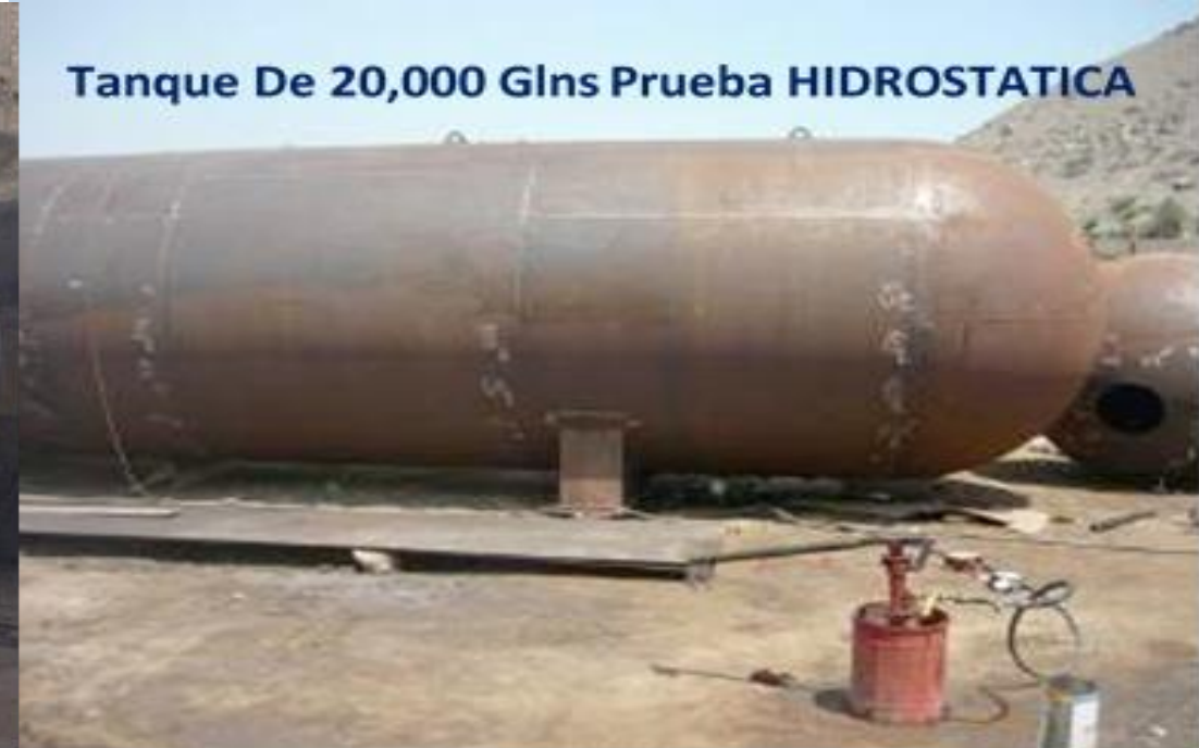
Tanque De 20,000 Glns Prueba HIDROSTATICA