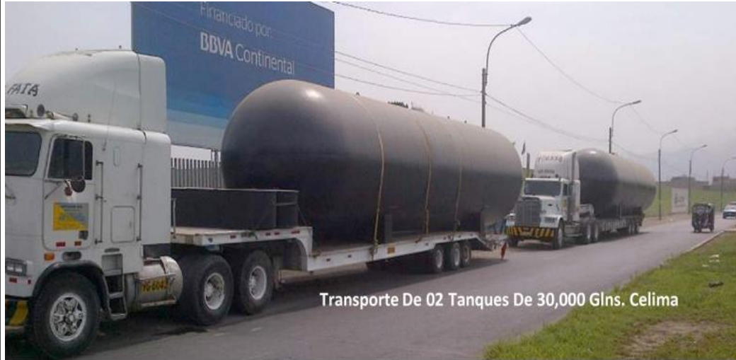
Transporte De 02 Tanques De 30,000 Glns. Celima