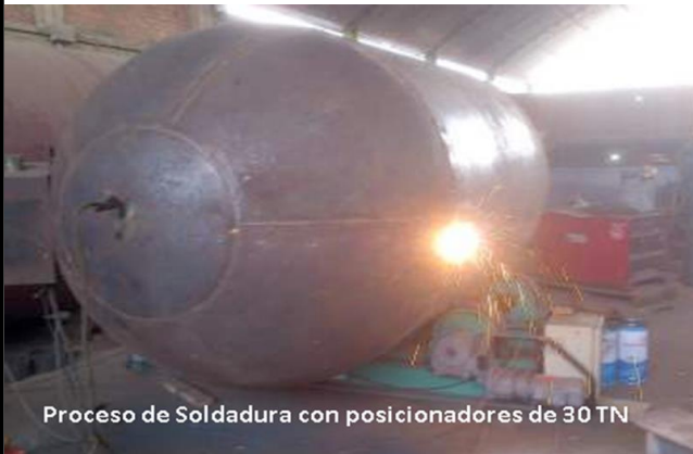
Proceso de Soldadura con posicionadores de 30 TN