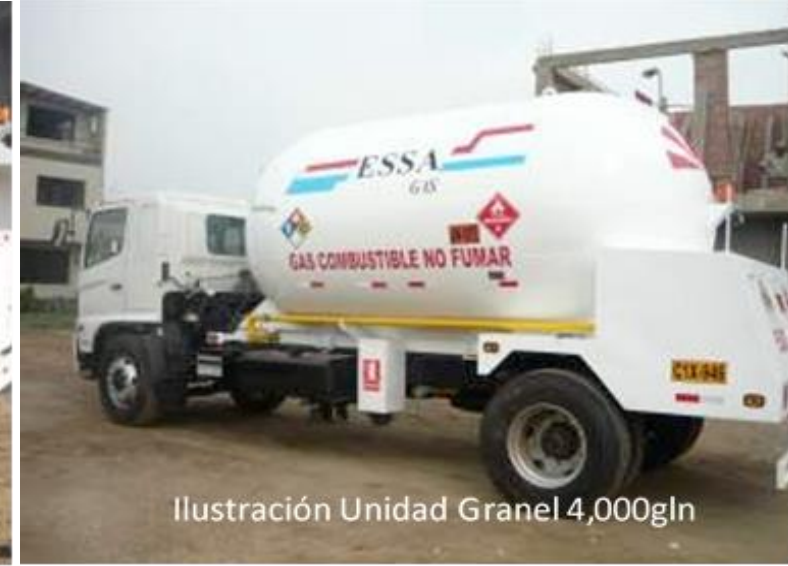
Ilustración Unidad Granel 4,000gln