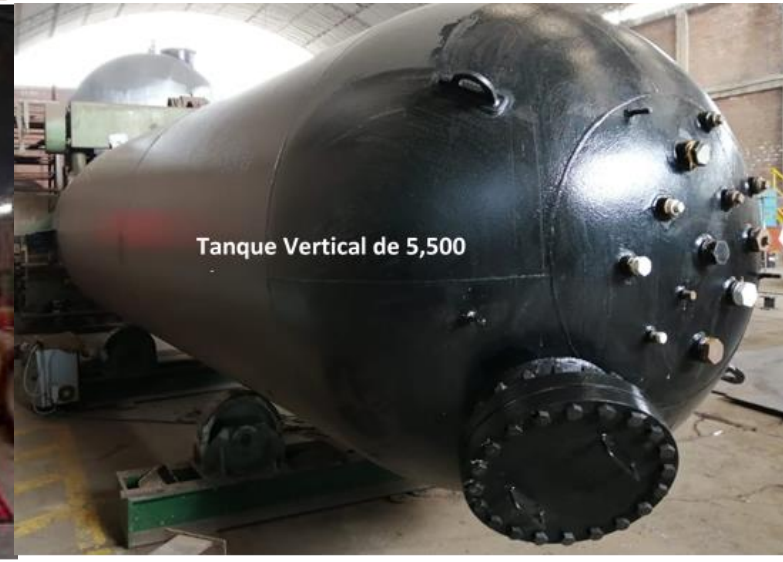
Tanque Vertical de 5,500