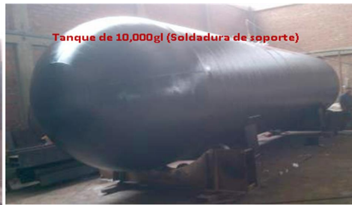
Tanque de 10,000gl (Soldadura de soporte)