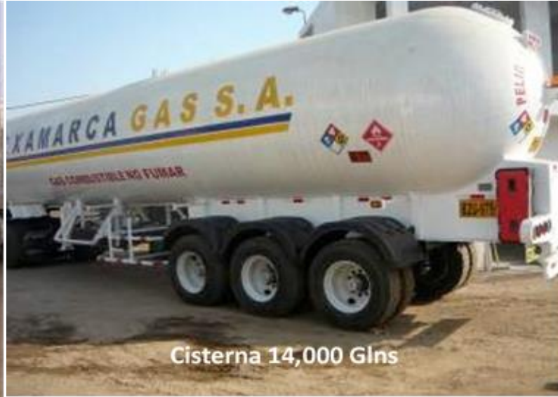
Cisterna 14,000 Glns